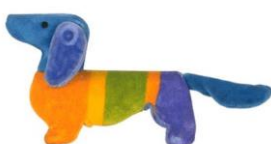
Такса Вальди (Летние Олимпийские игры 1972, Мюнхен)

Официально понятие «олимпийский талисман» было утверждено летом 1972 года на сессии МОК, проходившей в рамках XX Олимпийских игр в Мюнхене. Решением Комитета талисман стал обязательным атрибутом Олимпийских игр. Теперь в качестве талисмана может выступать любое существо, отражающее особенности культуры народа страны, принимающей Олимпиаду. Это может быть животное, человек, мифологический или сказочный персонаж.